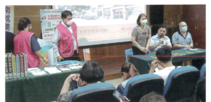
進修部學生媒合就業