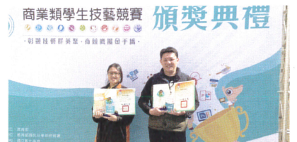
商業類科技藝競賽金手獎