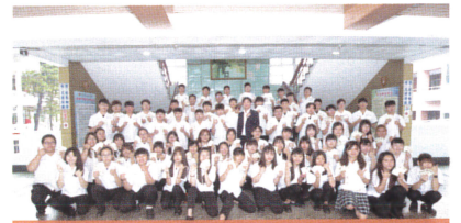
4張以上證照達人合照