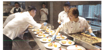
學生辦理感恩餐會